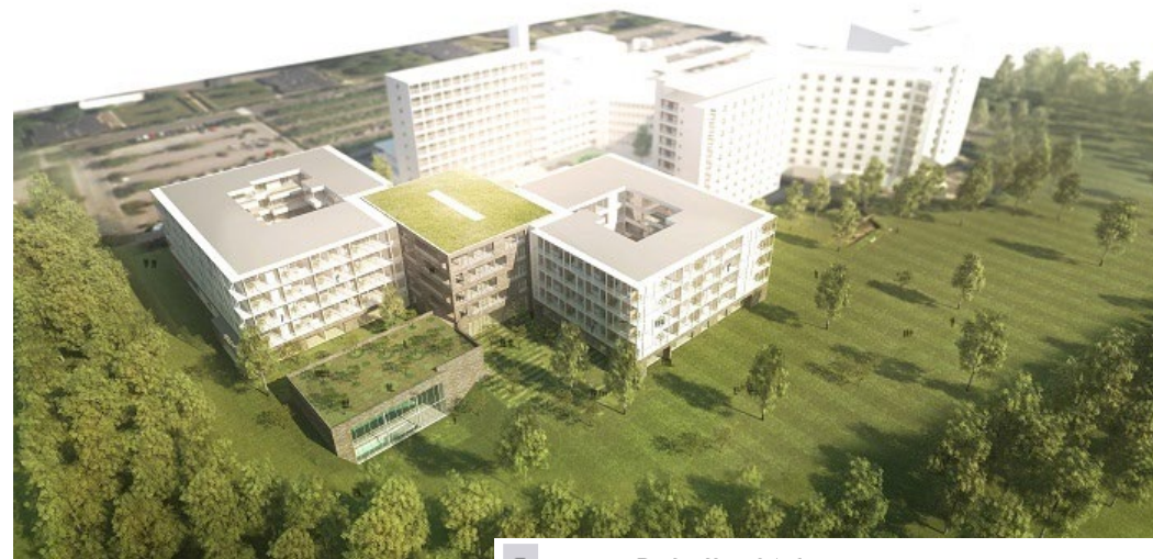
Region Hovedstaden VihTek – Videnscenter for velfærdsteknologi